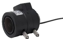
固定金具 (AP-200H) ※標準

f=2.7~13.5mm (TM2713IR) ※DC 駆動 f=5~50mm (TD0550IR) ※DC 駆動